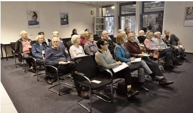
Symposium „Umgang mit den neuen Medien“ am 12.10.2017