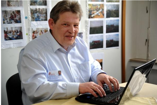
Projekt PC-Paten Generation 60 Plus

Ihr persönliches Engagement ist ebenfalls wünschenswert, ggf. auch als Patin/Pate und/oder Mitwirkende/r in ausgewählten Projekten Ihrer Neigung.